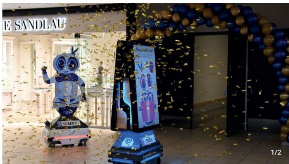
Robotten Rosa blev modtaget med klapsalver og konfetti, da den gjorde sin entré i centret.

En verdensnyhed er kommet til Odense, efter robotten Rosa meldte sin ankomst i Rosengårdcentret. Rosa er den første af sin slags, og hun skal sørge for at skabe gode oplevelser for centrets besøgende. Mødet med robotten resulterede i både smil, latter og præmier blandt gæsterne.